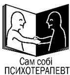
Сам собі ПСИХОТЕРАПЕВТ

Ці книжечки — матеріали із самодопомоги, що розробили провідні психотерапевти Оксфордського центру когнітивної терапії. Серія покликана надати коротку інформацію про поширені психічні розлади та базові техніки їх підходу для допомоги у їх подоланні. Інформація і техніки, подані у книжечках, спираються на теорію когнітивно-поведінкової терапії. Кожна книжечка містить інформацію про сутність розладу, його симптоми і прості поради стосовно того, як особа та її рідні можуть сприяти одужанню.