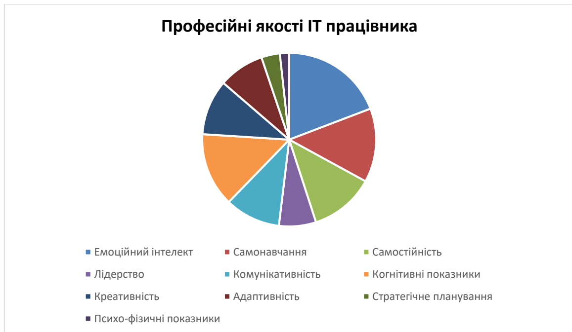
Рис.1. Перелік професійно важливих якостей працівника ІТ [1]

фахівця. Здатність до стратегічного планування (9,4%) дещо поступається у значенні для побудови його професійної кар'єри в ІТ-галузі. Частина фахівців вважають фізичні кондиції (18,8%) та психофізичні якості (4,7%–9,4%) цінними для високої продуктивності праці ІТ-спеціаліста. Окремі фахівці (по 4,7%) серед важливих якостей ІТ-фахівця називають надійність, критичне мислення, чесність, самоврядування, самовпевненість, міцну робочу етику та вміння керувати своїм часом.